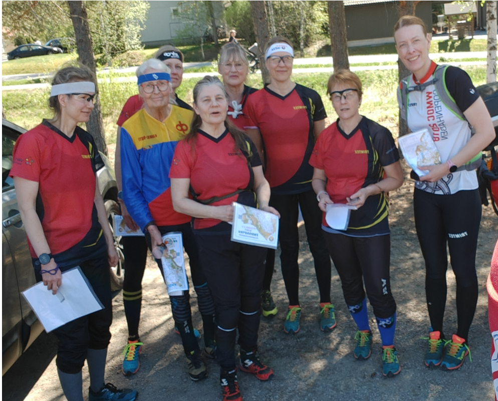
Taitoleirillä 2024 Kaarinassa